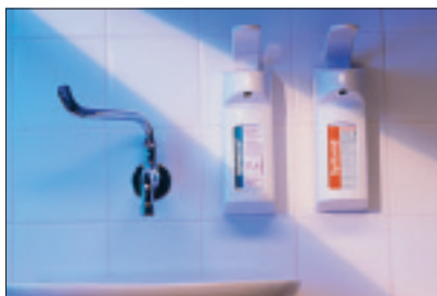
Patogus ir higieniškas dozavimas naudojantis mūsų Dermados ® tipo dozatoriais

Aqua, Paraffinum liquidum, Octyl Palmitate, Glicerol, Sorbitan Oleate, Polyglyceryl-3 Ricinoleate, Lactic Acid, Magnesium Sulfate, Ascorbyl Palmitate, Glyceryl Oleate, Glyceryl Laurate, Arachis Hypogaea, Tocopherol, Citric Acid, Methylparaben, Propylparaben, Parfum